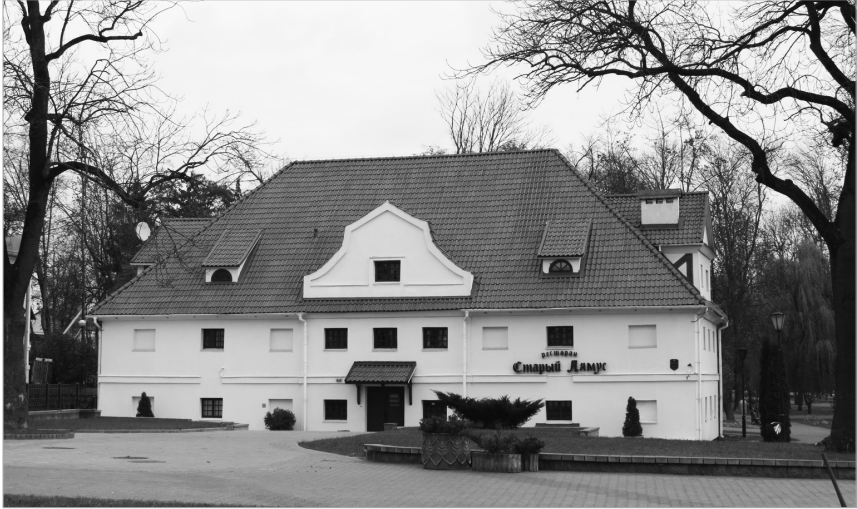
II. 4. Grodno, oficyna rezydentalna, fot. N. Slizh

Pałac wiceadministratora (nr 8) łączył w siebie cechy baroku i klasycyzmu. W roku 1780 prace budowlane nie były jeszcze zakończone. Obecnie jego wnętrze bardzo zmieniono. Oficyna wiceadministratora była zbudowana do celów administracyjnych 27 .