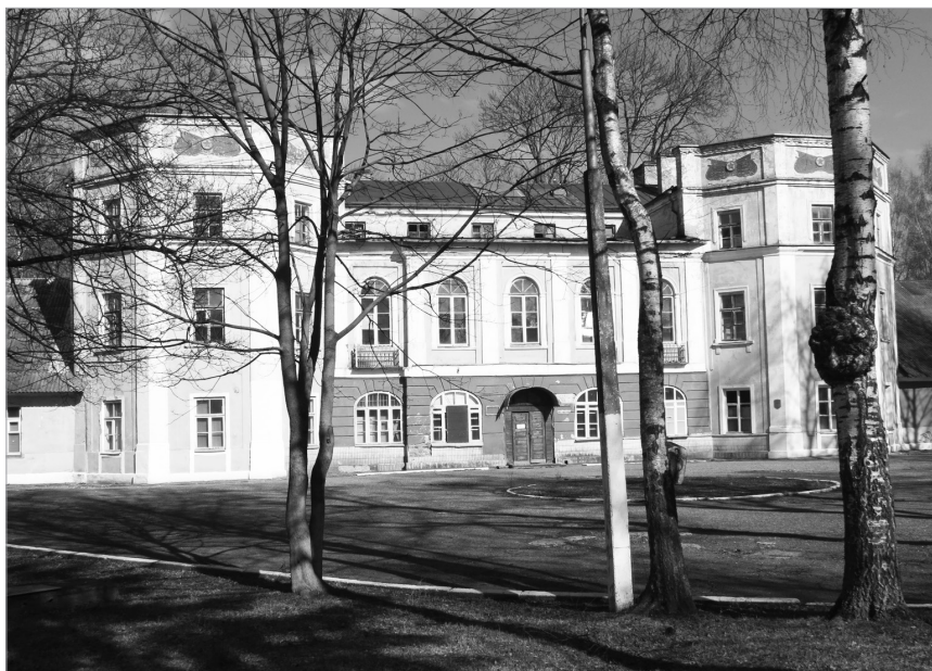
Il. 5. Grodno, akademie medyczna

Za pałacem znajdowały się akademie medyczna, czyli Królewska Szkoła Lekarska, zbudowana w stylu późnego baroku (il. 5) 29 , i ogród botaniczny. Z notatek Bernoulliego wynika, że w 1778 roku budynek akademii był wzniesiony, ale prace wewnątrz jeszcze nie zostały ukończone. Uczelnia mieściła się w odremontowanych pokojach. Jednak w 1777 roku Stanisław August oglądał gabinety 30 . Ogród założono około 1777 roku 31 . Na terenie ogrodu była oficyna dla ogrodnika z dwiema oranżeriami (nr 21).