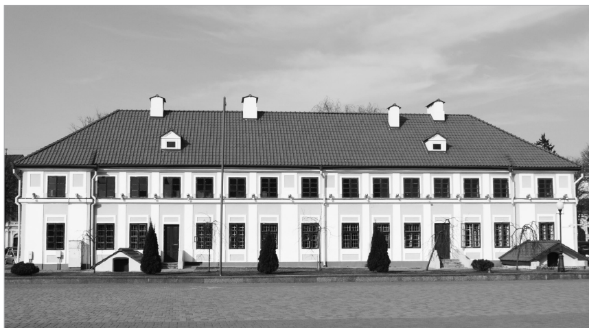
Il. 3. Grodno, oficyna gościnna

Do kompleksu pałacowego prowadziły trzy drogi: dwie symetryczne do ostatnich oficyn, jedna przez most – do miasta, a trzecia centralna, przez most do oficyny wiceadministratora. Dwie oficyny – rezydentalna (nr 6, il. 4) i stajenna (nr 7) – mieściły się obok, jedna naprzeciwko drugiej. Oficyna stajenna istnieje do dzisiaj. Oprócz kordegardy wszystko zostało ukończone.