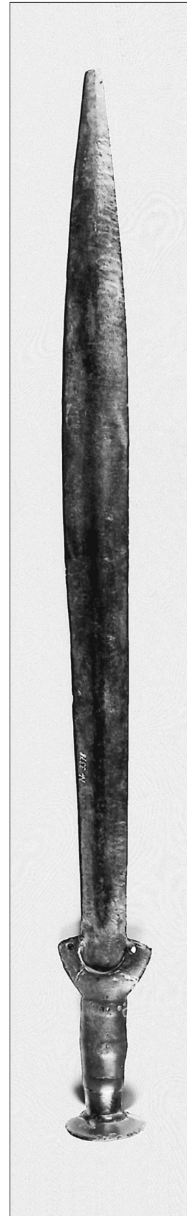
Fig. 2. Brązowy miecz typu liprowskiego z Kobiernic, pow. Bielsko-Biała, woj. śląskie.