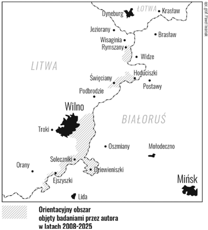
Rys. 4. Mapa ukazująca obszar objęty badaniami autora w latach 2008–2025.

W okresie późniejszym powtórzyłem ekspedycje terenowe na terenach badanych przeze mnie w latach wcześniejszych oraz przebadiałem nowy areał – wsie położone od Bytrymańc po Koleśniki. Na rok 2026 zaplanowałem przeprowadzenie kolejnych ekspedycji dialektologicznych w rejonach: trockim oraz wileńskim.