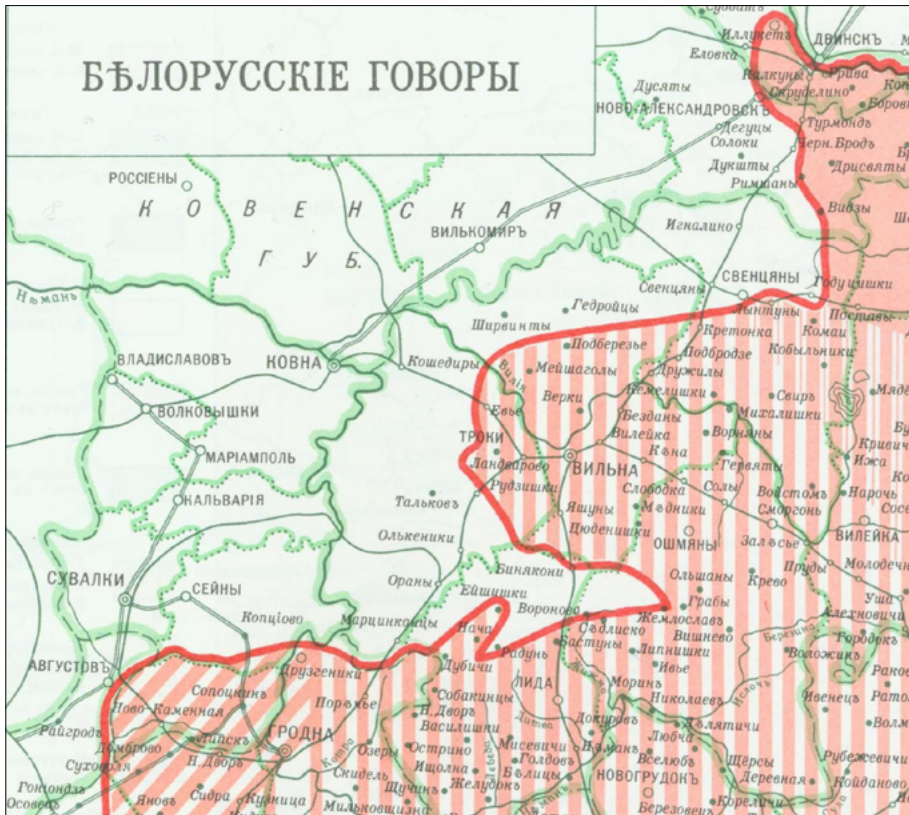
Rys. 1. Fragment mapy J. Karskiego pt. Etnograficzna mapa etnosu białoruskiego , Warszawa 1903 r.

[...] круто повернувъ около г. Иллукаста, идетъ въ ю.-з. направленіи вдоль границы этого уезда съ Новоалександровскомъ у. Ковенской г.; пересѣкши этотъ послѣдній въ в. его части, она опять загибаетъ на Ю, на Ю-З и З, опять на Ю-З, Ю-В и В, описывая такимъ образомъ в Виленской г. почти кругъ въ бассейнѣ р. Вилии, а именно проходитъ по уу.: Свенцяньскому, Виленскому, Троцкому, западнѣе г. Трокъ, далѣе почти по границѣ Виленскаго у. съ Лидскимъ и входитъ въ в. направленіи въ Ошмянскій у. Здѣсь, немного не доходя г. Ошмянъ, граница еще разъ круто поворачиваетъ и въ обратномъ направленіи идетъ по Ошманскому у., пересѣкаетъ Лидскій у. сѣвернѣе г. Лиды, входитъ въ Гродненскую г., гдѣ идетъ почти по границѣ Гродненскаго у. съ Троцкимъ у. Виленской г. до р. Нѣмана, затѣмъ вѣрхъ по Нѣману, далѣе опять на З приблизительно по границѣ Августовскаго и Сейненскаго уу. Сувалкской г. [...] [Durnovo, Sokolov", Ušakov" 1915: 5].