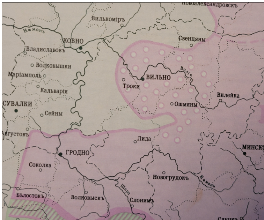
Rys. 2. Fragment mapy Опыт диалектологической карты русского языка , opracowanej przez Moskiewską Komisję Dialektologiczną, 1915 r.

bardzo duży obszar europejskiej części Imperium Rosyjskiego. W dużej mierze pokrywa się jednak z wynikami prac J. Karskiego. Poniżej zamieszczam fragment tej mapy, ukazujący pogranicze białorusko-bałtyckie.