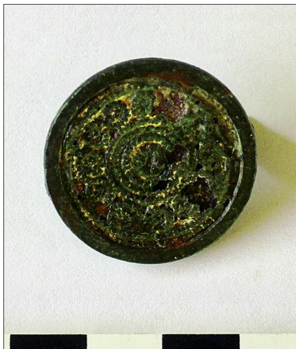
Fig. 6. Plate fibula.

dr Martin Lemke Antiquity of Southeastern Europe Research Center, University of Warsaw m.lemke@uw.edu.pl