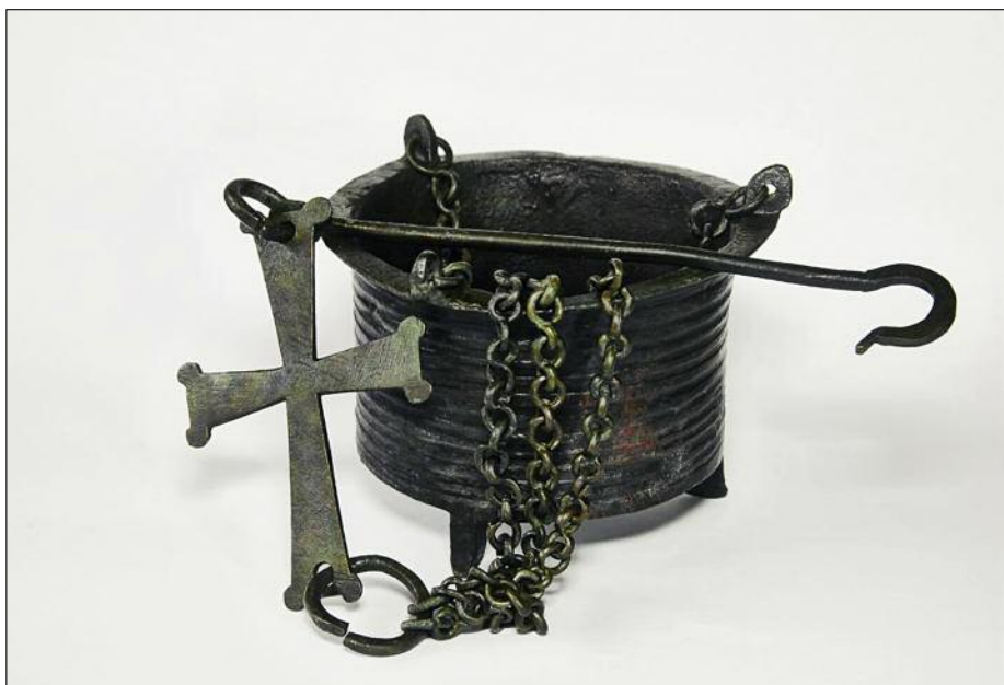
Fig. 8. Byzantine bronze censer.

Ryc. 8. Bizantyjska kadzielnica z brązu.