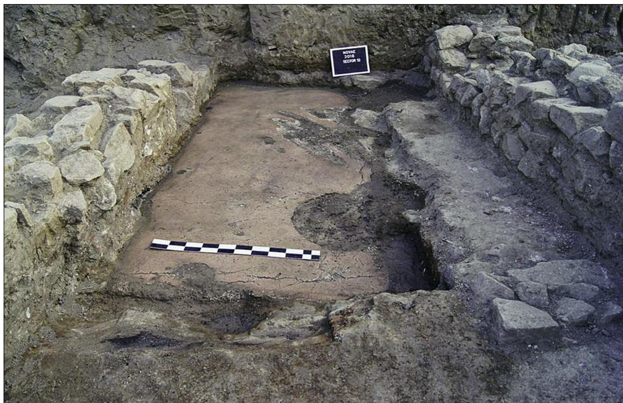
Fig. 4. Plastered floor of a bath.