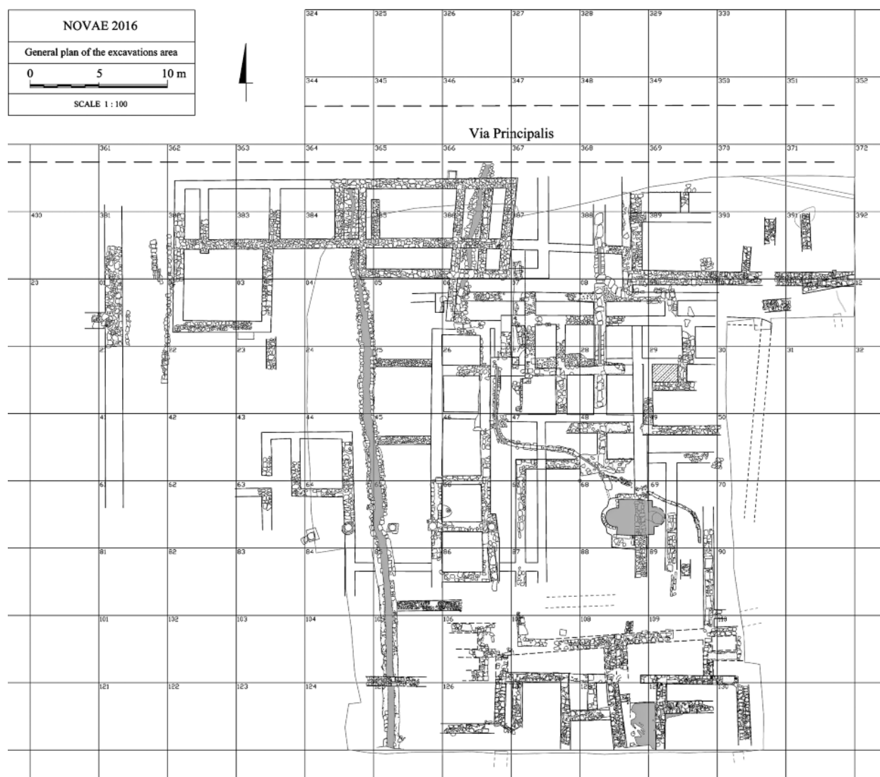
Fig. 2. Sector 12 after the 2016 campaign (drawing by P. Dyczek, M. Lemke, M. Różycka, and B. Wojciechowski).

Ryc. 2. Sektor XII po kampanii w 2016 r. (ryc. P. Dyczek, M. Lemke, M. Różycka i B. Wojciechowski).