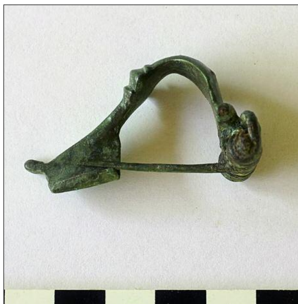
Fig. 7. Almgren 68 type fibula.

Ryc. 6. Fibula tarczowata.