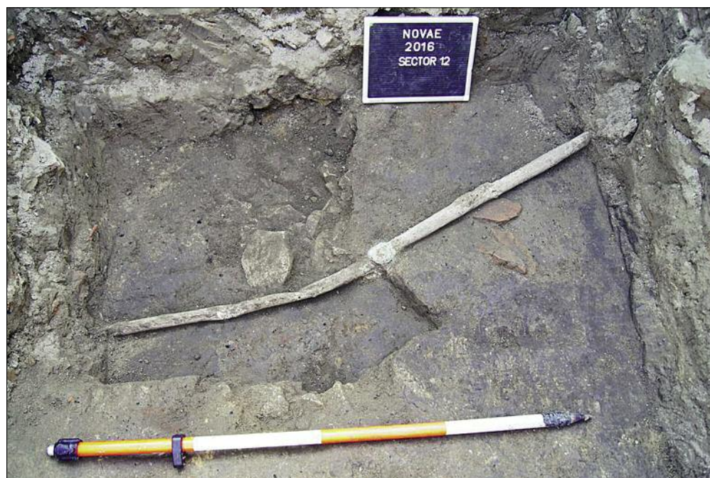
Fig. 3. Fistulae.

Ryc. 2. Sektor XII po kampanii w 2016 r. (ryc. P. Dyczek, M. Lemke, M. Różycka i B. Wojciechowski).