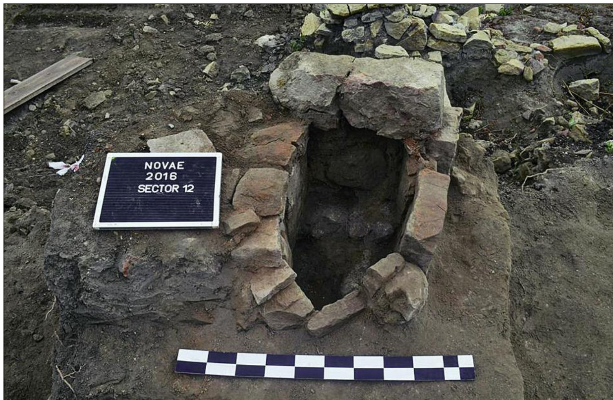
Fig. 5. Late antique or early medieval kiln or hearth.

Ryc. 5. Późnoantyczny/ wczesnośredniowieczny piec.