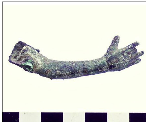
Fig. 7. Arm of a small bronze statue. Ryc. 7. Ręka figurki z brązu.

to come. On the outside of the building in question a pavement of large stone slabs and a cobbled street running along the E-W axis were discovered with a covered sewage canal running parallelly along its southern side. As the said street was further explored, it turned out that there was a junction, where another street (1.3 m wide) branched off towards the south ( Fig. 5 ). On the opposite side of the street, rooms of another building were unearthed.