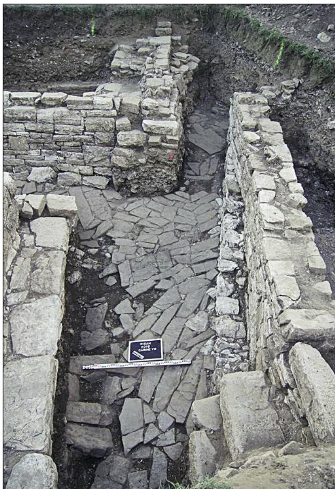
Fig. 5. Illyrian or Early Hellenistic street junction.

of broken pottery, particularly amphorae, underneath. These layers accumulated at some point in modern times. After reaching bedrock in the northern part of the trench and the depth of about 0.30 m a.s.l. in the southern part, when emerging ground water made a further descent impossible, the excavations of the 2016 campaign revealed very interesting architectural features first explored in 2015 and interpreted as a mansion-like edifice of the local Illyrian aristocracy (Fig. 3, 4). This particular wall was made of large stone blocks, however not in the common polygonal 'cyclopean' technique (FABER 1992) with stones well-fitted in shape, but not in size. Instead, stone blocks of a similar height were cut, so that they had a decorative bossage on the outer surface. The building was promptly given the working name 'palace', which awaits further verification in the campaigns