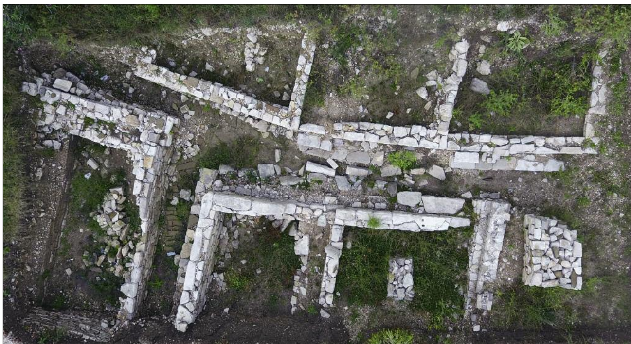
Fig. 8. Carine VIII after the initial attempts at conservation (photo by M. Lemke). Ryc. 8. Carine VIII po pierwszych próbach konserwacji (fot. M. Lemke)

Apart from the fieldwork, a geophysical survey was also performed in 2016. Several tools, i.e. the magnetic method, the soil resistivity method, or a ground-penetrating radar, could be employed (PISZ, HEGYI, GERGELY,