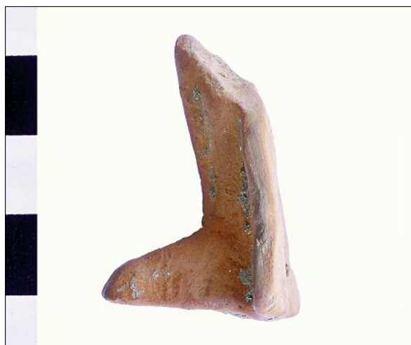
Fig. 6. Leg of a small clay statue. Ryc. 6. Noga posążka terakotowego.