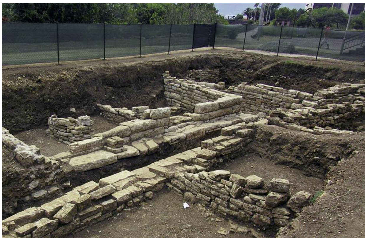
Fig. 4. The 'palace' at Carine VIII. Ryc. 4. "Pałac" na Carine VIII.

of broken pottery, particularly amphorae, underneath. These layers accumulated at some point in modern times. After reaching bedrock in the northern part of the trench and the depth of about 0.30 m a.s.l. in the southern part, when emerging ground water made a further descent impossible, the excavations of the 2016 campaign revealed very interesting architectural features first explored in 2015 and interpreted as a mansion-like edifice of the local Illyrian aristocracy (Fig. 3, 4). This particular wall was made of large stone blocks, however not in the common polygonal 'cyclopean' technique (FABER 1992) with stones well-fitted in shape, but not in size. Instead, stone blocks of a similar height were cut, so that they had a decorative bossage on the outer surface. The building was promptly given the working name 'palace', which awaits further verification in the campaigns