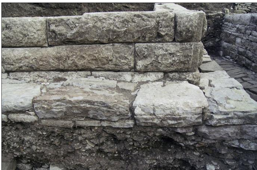
Fig. 3. Monumental wall with bossage ('palace') at Carine VIII (photo by M. Lemke).

The stratigraphy of the topmost layers very much resembled the situation in the 2015 trench, i.e. it consisted of a rubble layer followed by another one with many sherds