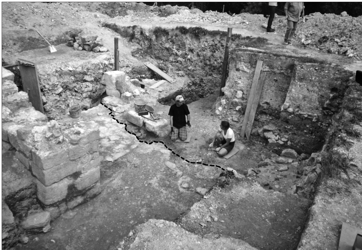
Ryc. 3. Chełm, wykop 23 (widok od strony SW). Po lewej (w głębi) widoczna część bramna pałacu; w środku – zaznaczona krawędź zniszczonej warstwy posadzkowej; po prawej – częściowo wyeksplorowane rumowisko destrukcji budowli ze śladami pożaru.

Fig. 3. Chełm, Trench 23 (view from SW). On the left (in the background) the gate part of the palace can be seen; in the centre – marked edge of a destroyed paved floor layer; on the right – partially explored rubble of damaged remains of the building with traces of fire.