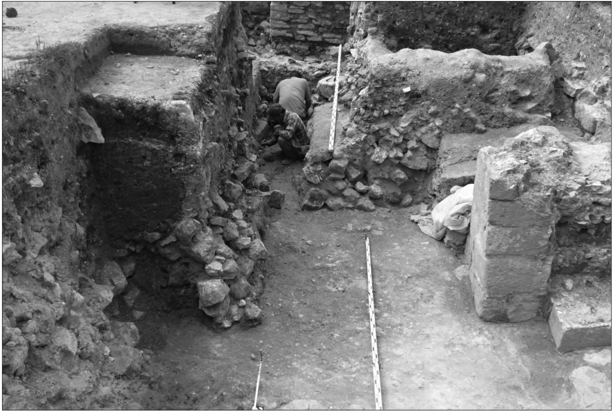
Ryc. 4. Chełm. Widok posadzki (poziom użytkowy fazy I) w kierunku W. Po prawej – narożnik części bramnej rezydencji; po lewej – warstwy destrukcji kamiennych powyżej poziomu posadzki; w głębi – dolna część i stopa fundamentowa prostokątnej wieży (II faza budowlana).

Fig. 4. Chełm. View of the paved floor (usage level of Phase I) to W. On the right – corner of the gate part of the residence; on the left – layers of damaged stone remains above the paved floor level; in the background – bottom part and the foundation footing of the rectangular tower (building of Phase II).