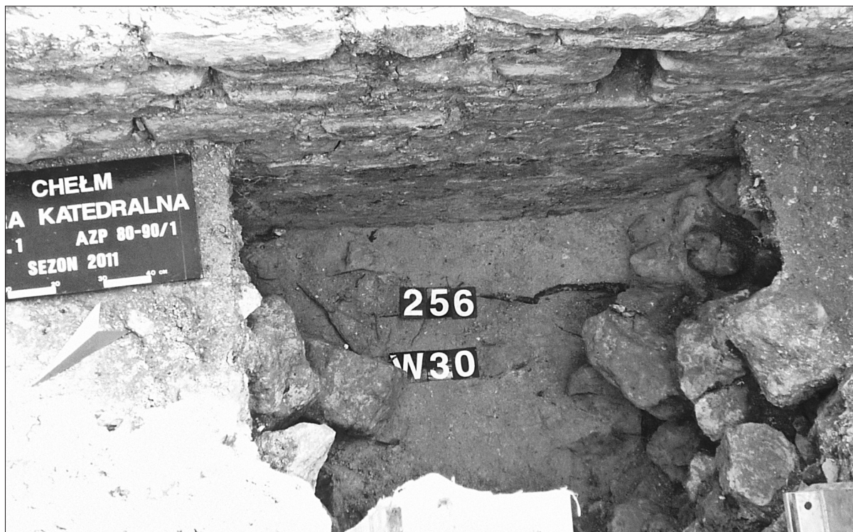
Ryc. 5. Chełm, wykop 30 (na zewnątrz muru obwodowego rezydencji). Widoczne lico zewnętrzne muru, oraz przylegające do niego warstwy destruktyw. Numerem 256 oznaczono poziom wylewki wapiennej.

Fig. 5. Chełm, Trench 30 (outside the circumferential masonry wall of the residence). The external face of the masonry wall and adjoining layers of destroyed remains are visible. No. 256 marks the level of lime screed.