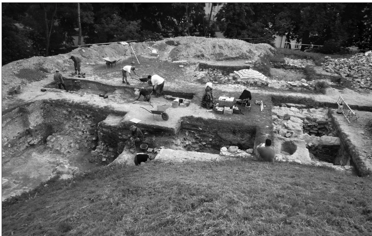
Ryc. 1. Chełm, południowa część Wysokiej Górki. Widok na wykopy z kulminacji kopca centralnego. Na pierwszym planie po lewej – wykop 23 z wejściem na teren zespołu rezydencjonalnego.

Fig. 1. Chełm, southern part of Wysoka Górka (High Hillock). View on the trenches from the culmination of the central mound. In the foreground on the left – Trench 23 with the entrance to the area of the residential complex.