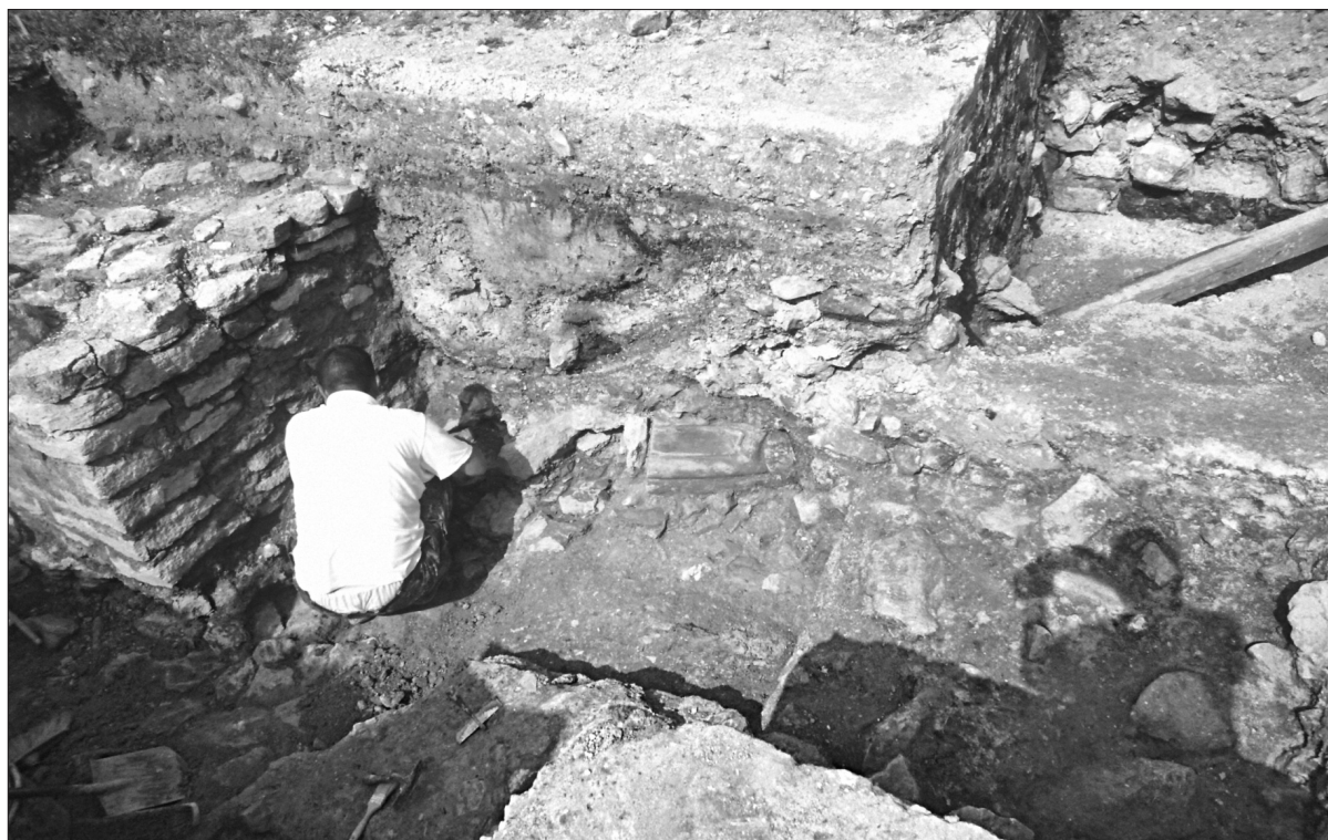
Ryc. 6. Chełm, wykop 26 w trakcie eksploracji (widok od strony S). Po lewej – narożnik kamiennej wieży, wybudowanej na warstwie destruktyw budowli pałacowej fazy I; w dolnej części profilu – zdobiony detal architektoniczny z zielonego glaukonitytu.

Fig. 5. Chełm, Trench 30 (outside the circumferential masonry wall of the residence). The external face of the masonry wall and adjoining layers of destroyed remains are visible. No. 256 marks the level of lime screed.