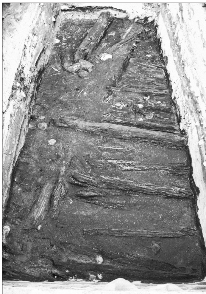
Ryc. 3. Widok belek i płatów kory w planie wykopu 04, zachowanych w jednym z poziomów użytkowych dawnego rynku miejskiego w Lęborku.

Fig. 2. View of the southern façade of the Gothic Town Hall and the building of the reeveship in Lębork on a ca. 1870 photo.