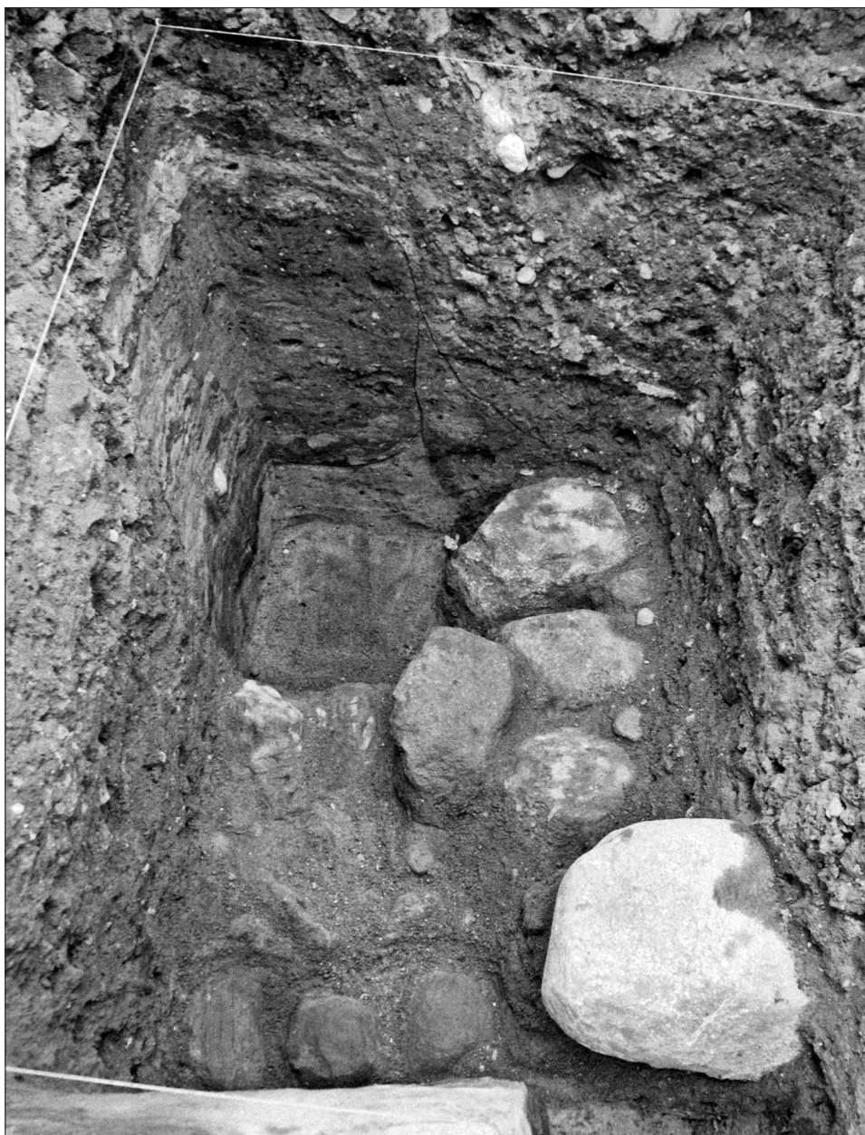
Ryc. 4. Widok południowo-wschodniego narożnika fundamentów dawnego ratusza łębarskiego, odsłoniętych w wykopie 05 (fot. M. Starski).

Fig. 4. View of the south-eastern corner of foundations of the former Town Hall in Łębork, exposed in Trench 05.