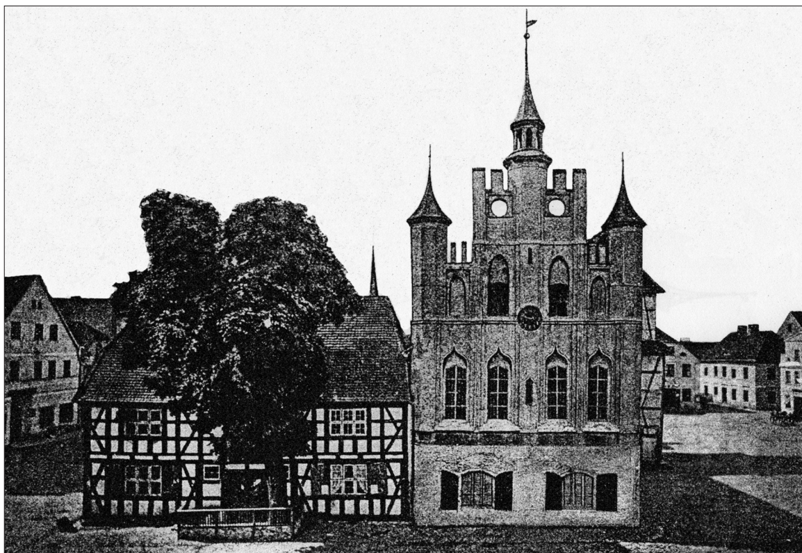
Ryc. 2. Widok południowej fasady ratusza gotyckiego i budynku wójtostwa w Lęborku na fotografii z ok. 1870 r. (LEMCKE 1911: ryc. 97).

Fig. 2. View of the southern façade of the Gothic Town Hall and the building of the reeveship in Lębork on a ca. 1870 photo.