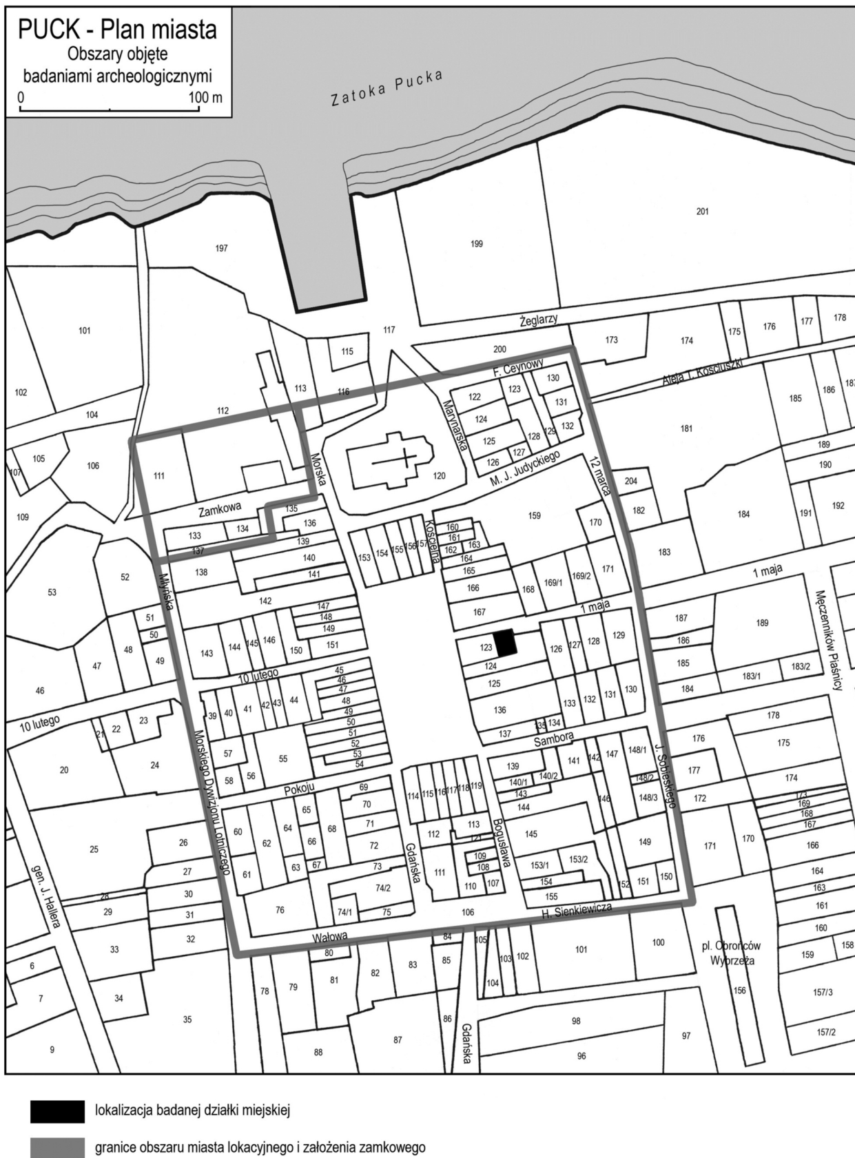
Ryc. 1. Współczesny plan Pucka z lokalizacją terenu badań archeologicznych (oprac. M. Starski).