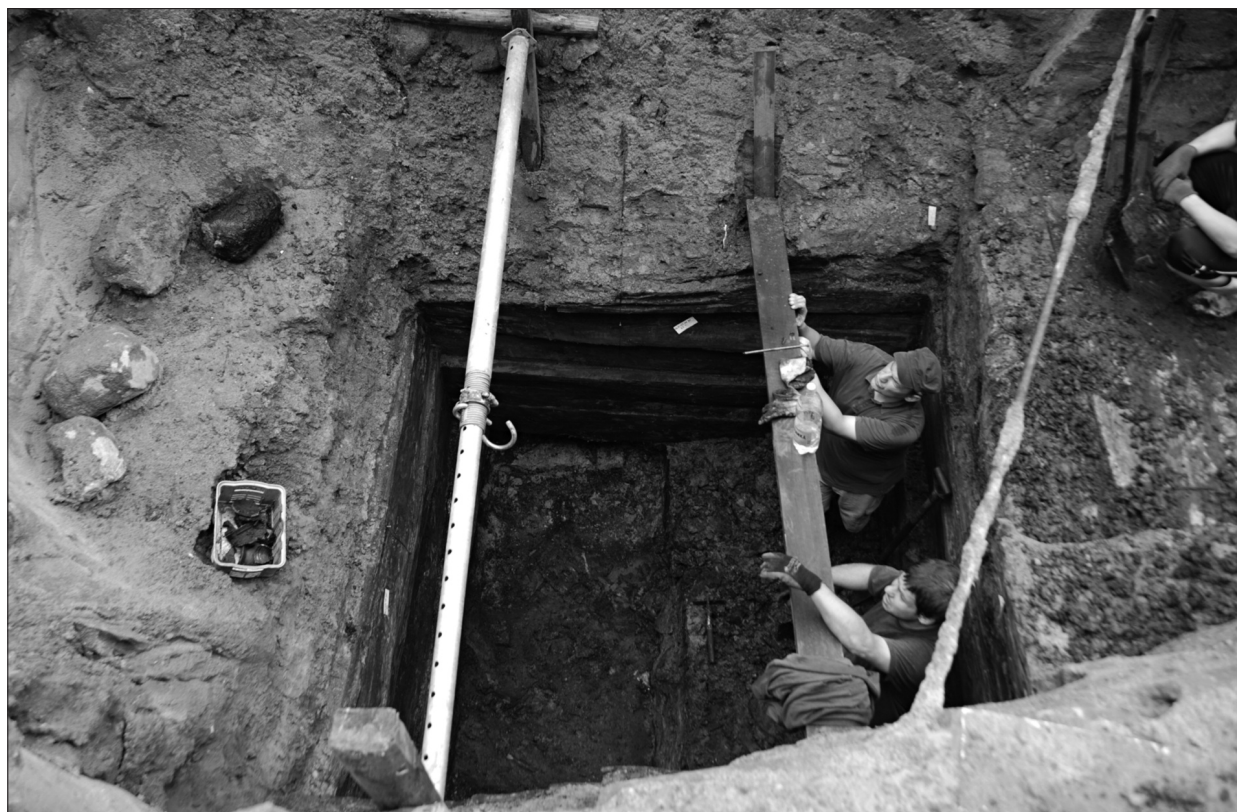
Ryc. 3. Puck, dz. 123. Widok latryny z 3. ćwierci XIV wieku w trakcie eksploracji.