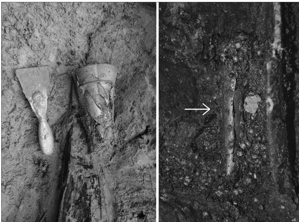
Ryc. 4. Puck, dz. 123. Fragmenty pucharów fletowanych in situ.