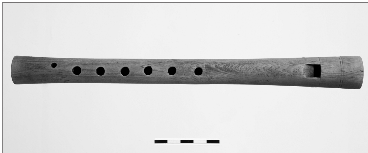
Ryc. 5. Puck, dz. 123. Flet drewniany z wypełniska latryny.