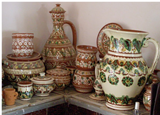
Фото 1. Іванна Козак-Ділета, керамічні твори. Гуцулія 2020, https://huculia.info/place/ivanna-kozak-dileta-workshop-kosiv/ .