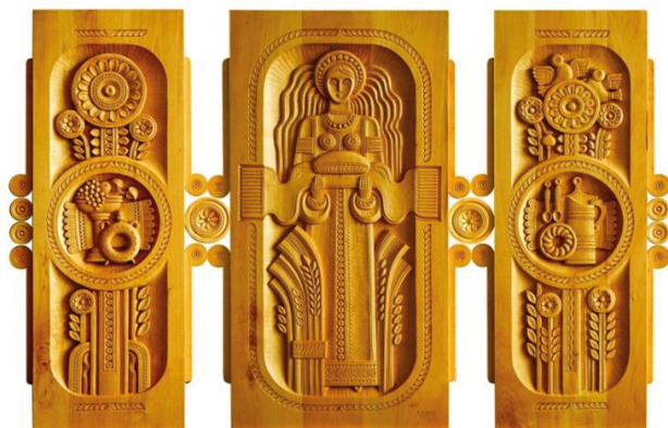
Фото 3. Дмитро Сивак, триптих „Хліб”. Дерево, різьблення, Івано-Франківськ 2007.