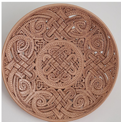
Фото 2. Юрій Стрипко, таріль орнаментальна. Глина, формування, ажурне вирізування, Косів.