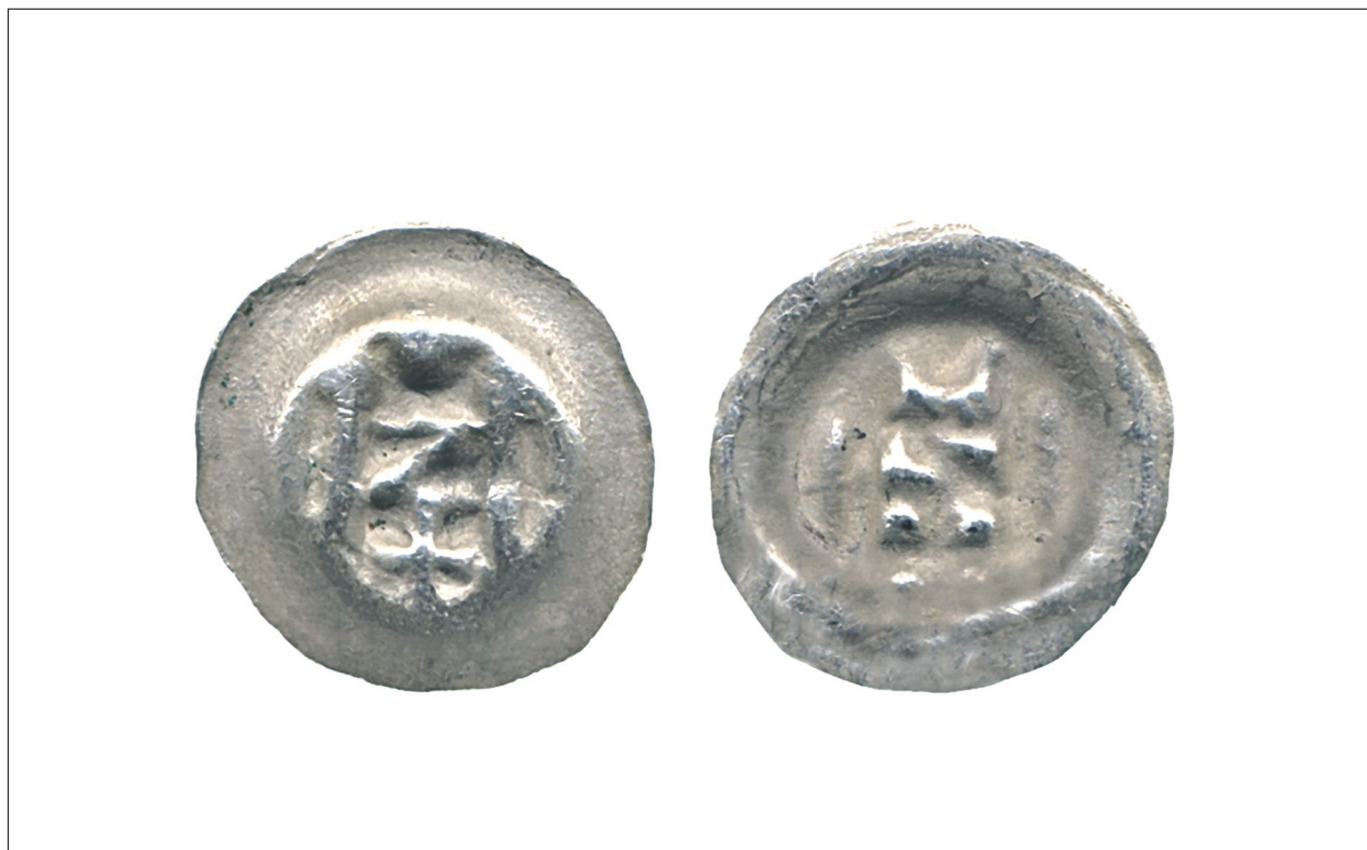
Fig. 1. Brakteat z przedstawieniem dwóch słupów, pomiędzy nimi symbol w kształcie litery Z, powyżej – kulka, poniżej – krzyż, Waschinski 198, 0,14 g, 12,4 mm