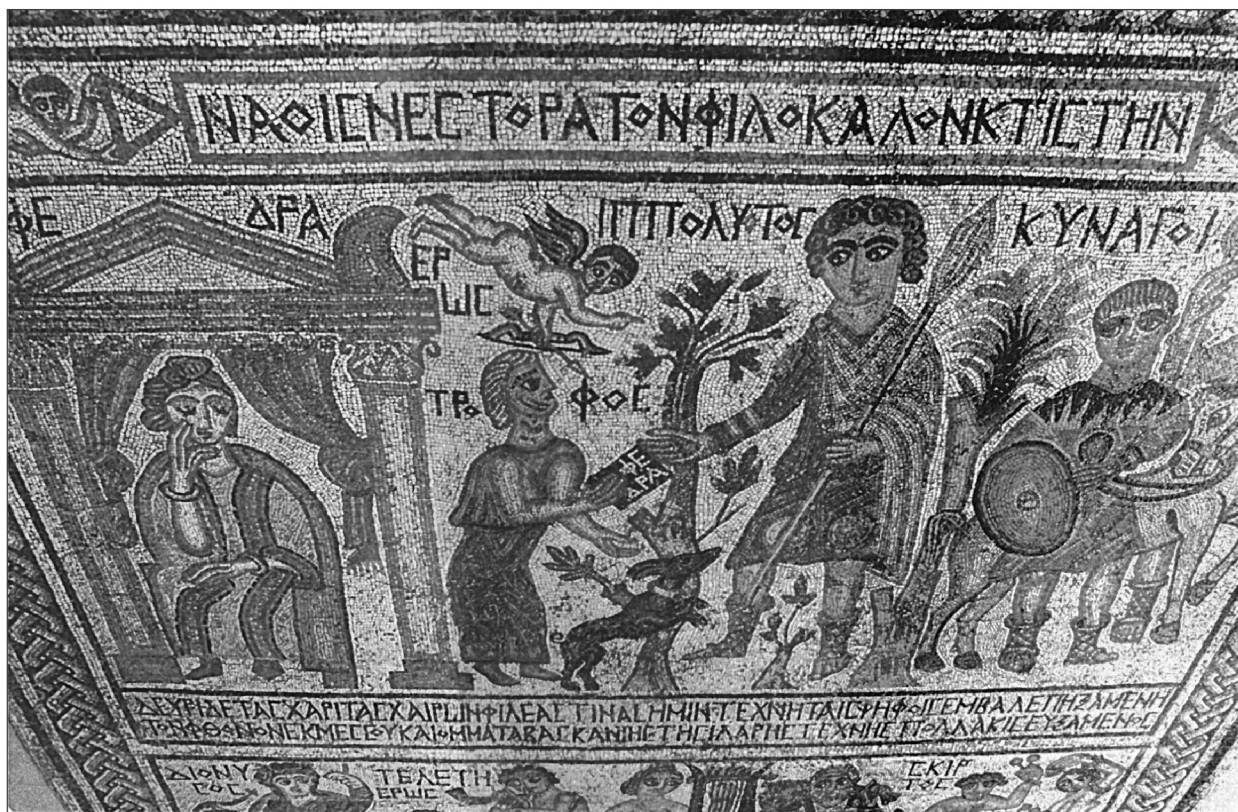
Fig. 3. Mozaika z Sheikh Zued; obraz ukazujący scenę kulminacyjną mitu o Hipolicie i Fedrze. Fot. T. Derda