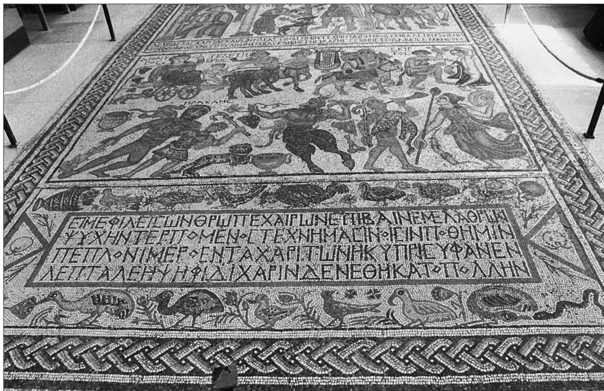
Fig. 2. Mozaika z Sheikh Zued; na pierwszym planie ukazany jest obraz z inskrypcją w tabula ansata , a na dalszym planie obraz centralny przedstawiający orszak dionizyjski.