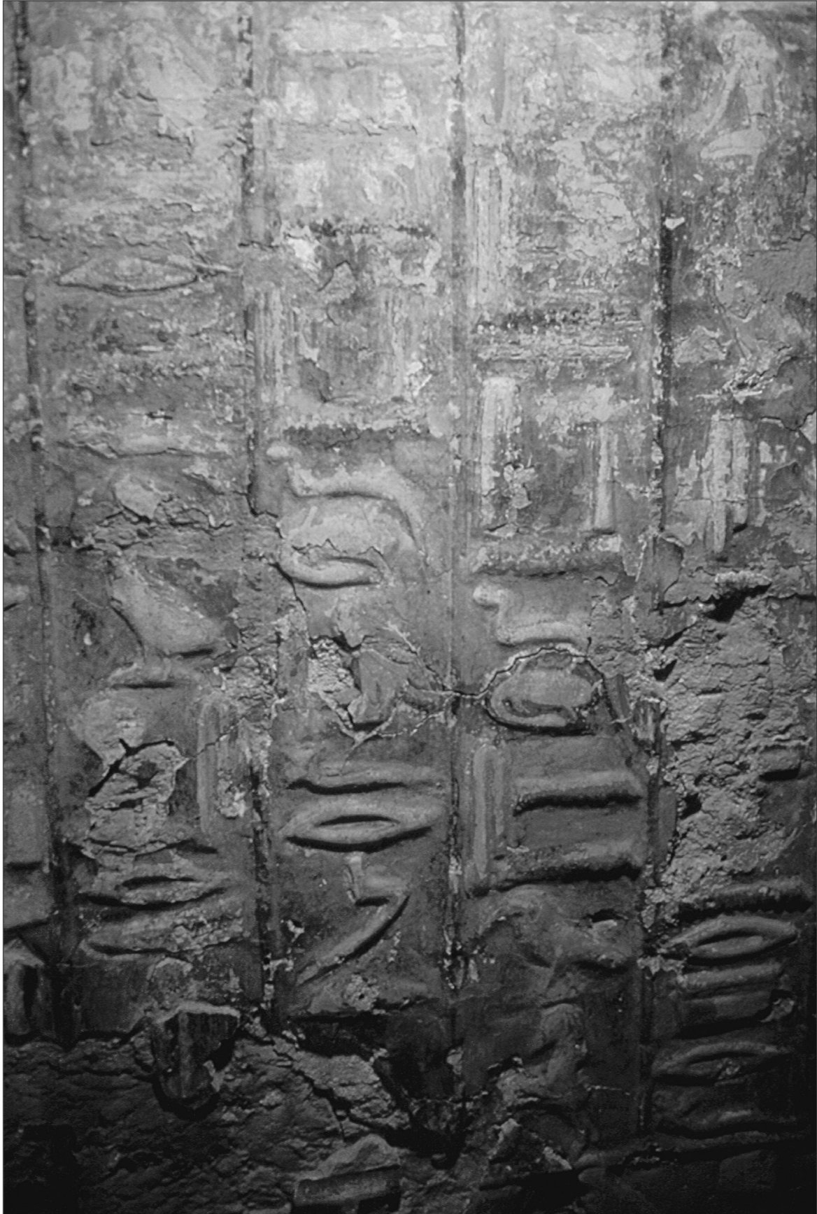
Fig. 5. Południowa część fasady kaplicy grobowej Merneferbefa (kolumny 12-15).