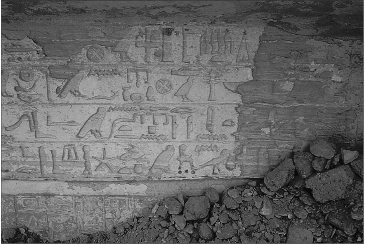
Fig. 1. Nadproże kaplicy grobowej Merefnebefa.