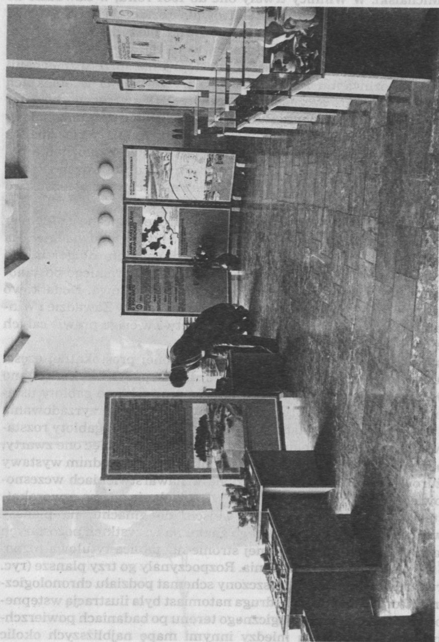
Ryc. 2. Widok głównej części wystawy