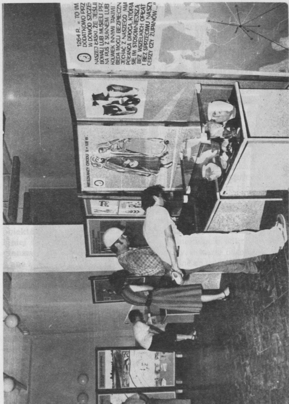
Ryc. 5. Zwiedzanie wystawy przez zaproszonych na jej otwarcie gości

niu z obecną zabudową przemysłową tego obszaru. Plansza czwarta b